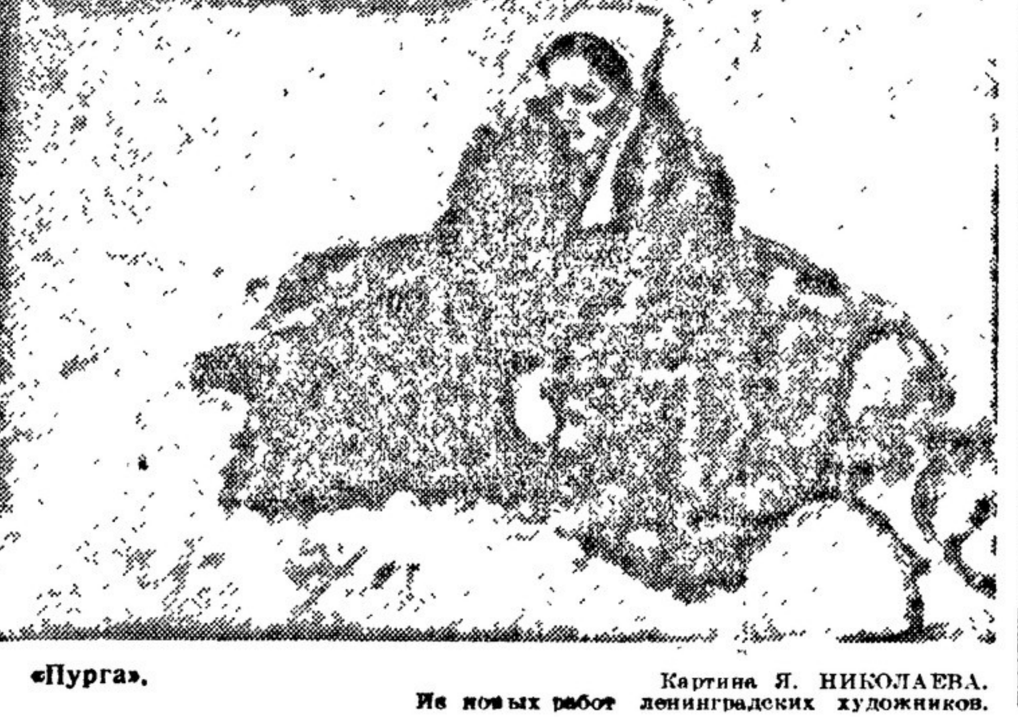
«Пурга». Картина Я. НИКОЛАЕВА.